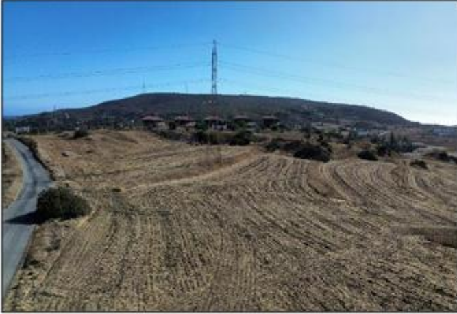
Φ/Σ: 55/25, Αρ. Τεμαχίου: 436, Αρ. Εγγραφής: 0/10200